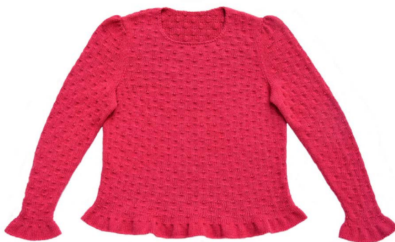
Cranberry (Eng, Ru)