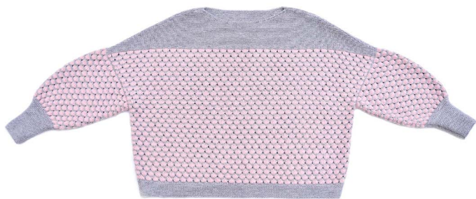
Dahlia (Eng, Ru)

NB! While slipping the first st transfer working yarn avoiding wrapping the first stitch.