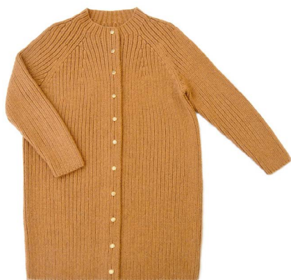
Drop (Eng, Ru)