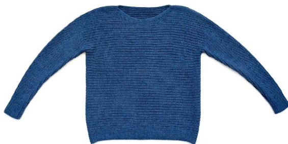
Aronia (Eng, Ru)