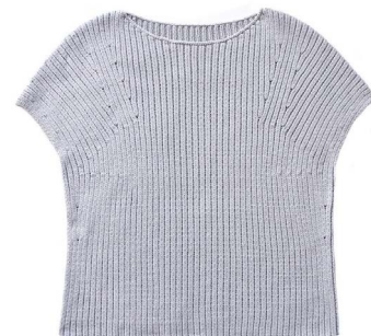
Stratus (Eng, Ru)